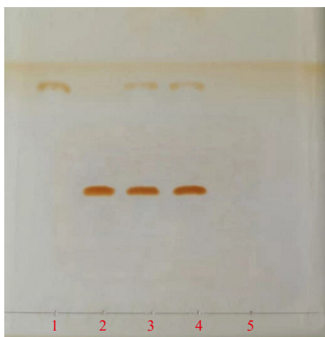
图 1 氯新酮乳膏中哈西奈德、酮康唑的薄层鉴别

取本品 1.0 g, 加甲醇 3 ml, 搅拌 2 min, 分取甲醇溶液并过滤, 于水浴上蒸发至干, 向残渣加入甲醇 0.5 ml, 搅拌 1 min, 置离心管中, 于冰水浴中冷却 1 h, 取出后迅速离心, 取上清液作为供试品溶液。另取哈西奈德对照品 1 mg、酮康唑 10 mg 分别加甲醇 0.5 ml, 振摇使溶解(必要时超声), 作为对照品溶液。照薄层色谱法(《中国药典》2020 版四部通则 0502) 试验, 吸取供试品溶液、对照品溶液各 10 \mu l, 分别点于同一硅胶 G 薄层板上, 以三氯甲烷-乙酸乙酯-甲醇(3 : 1 : 0.5) 为展开剂, 展开, 以碘蒸汽显色, 供试品色谱中, 在与对照品色谱相应的位置上, 显相同颜色的斑点, 阴性样品未见干扰(见图 1)。